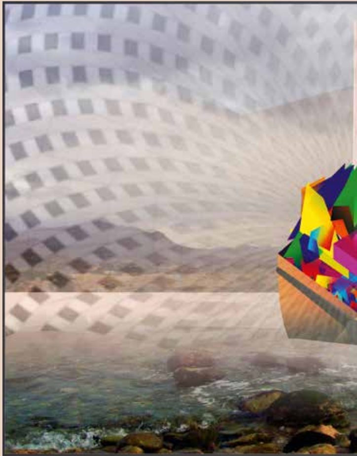
ARCA DE COLORS