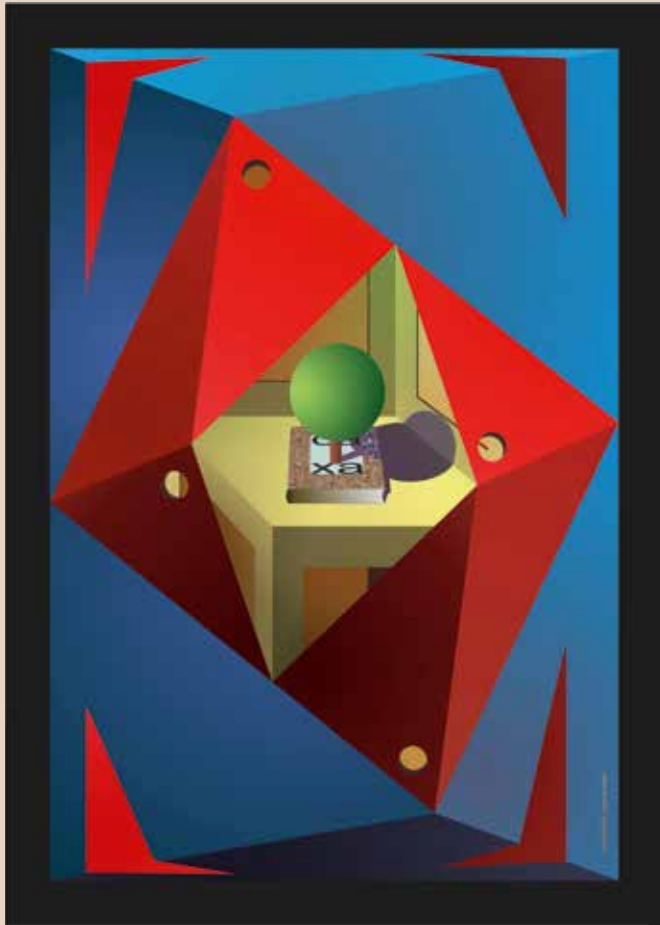
CAIXA DE COLORS