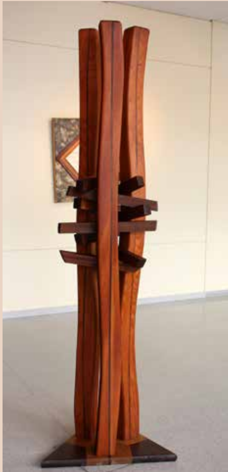
PLE DE FUSTA